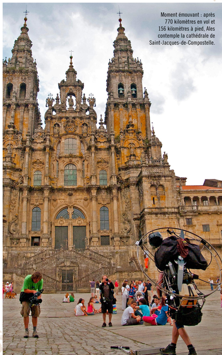
Moment émouvant : après 770 kilomètres en vol et 156 kilomètres à pied, Ales contemple la cathédrale de Saint-Jacques-de-Compostelle.