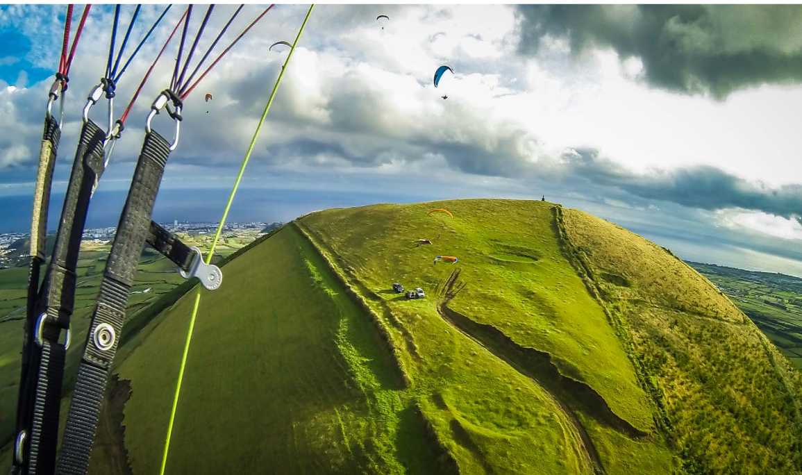
Site de Serra Gorda, avec vu sur la capitale Ponta Delgada. Derrière le mamelon se trouve l'aéroport !

Autre déco : orientation O - SO (N 37°52'15.89 - W 25°45'48.81), altitude 560 mètres, dénivellé 300 mètres : assez sportif, avec une petite pente raide hyper alimentée, suivi d'une falaise verticale de plusieurs centaines de mètres. Repose en haut possible... Pour les cadors. D'autres départs sont possibles autour du cratère, demander conseil aux locaux. Alternative, le O - NO (N 37°50'59.10 - W 25°45'37.18), altitude 760 m, dénivellé 500 m, plus facile. Atterro au bord du lac, partout où l'on veut, en respectant les cultures. Les locaux vous indiqueront le champ du jour.