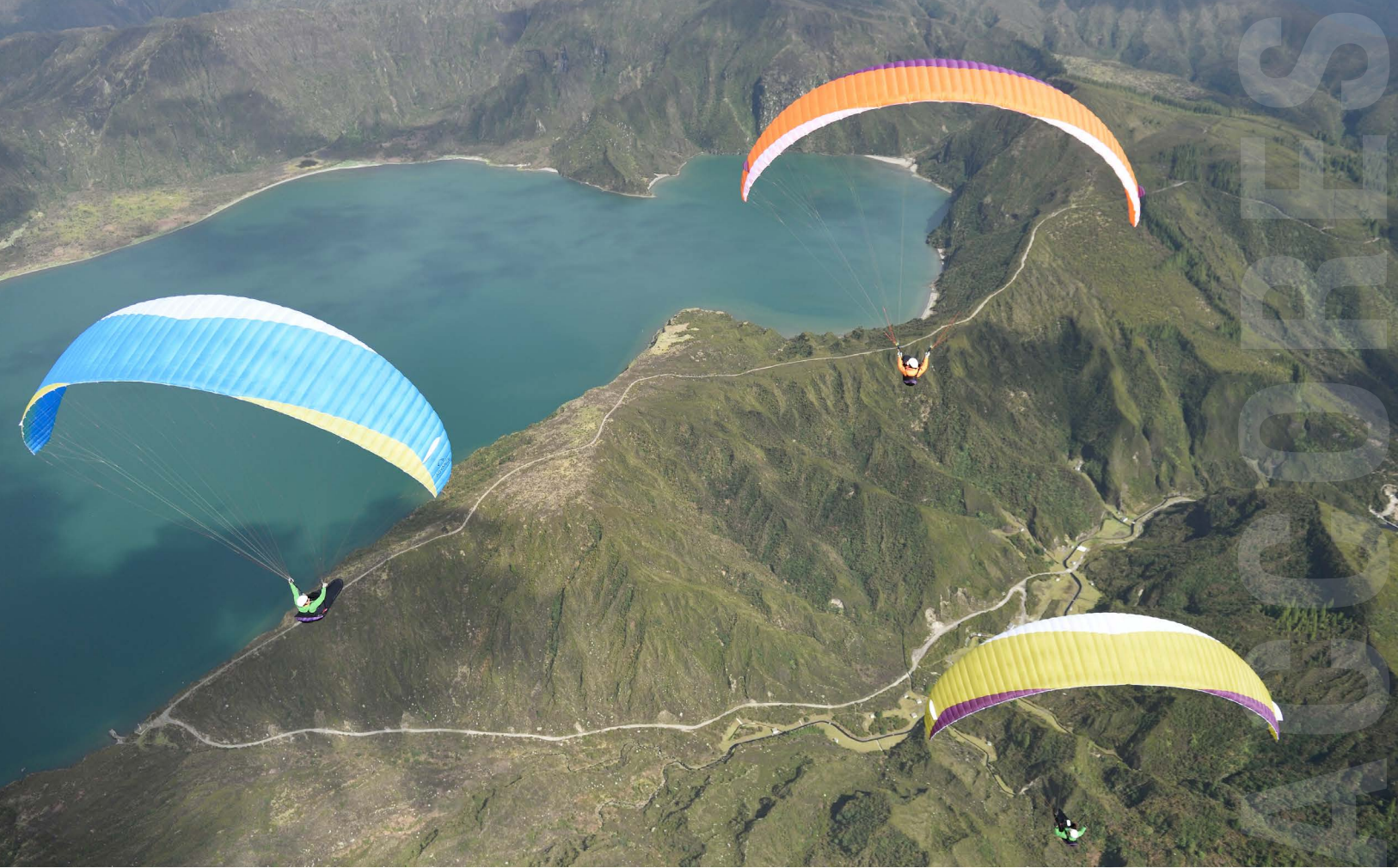
Les calderas des volcans sont omniprésents aux Açores