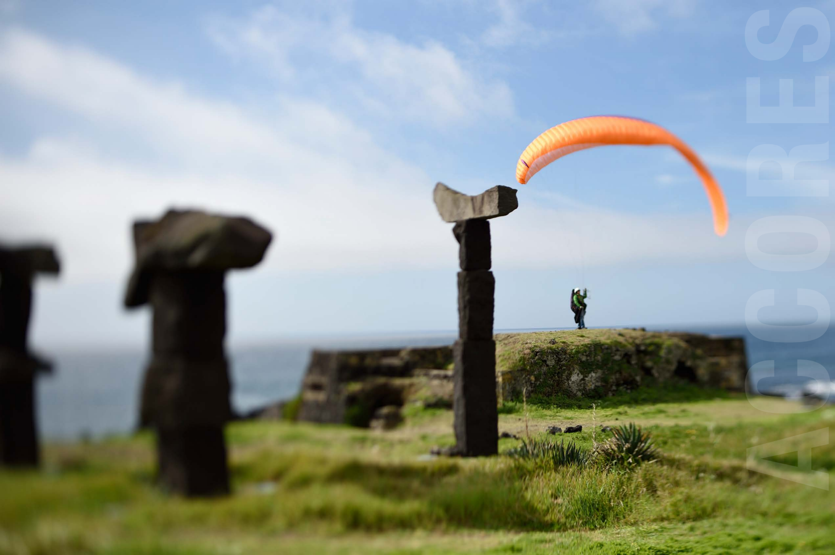
Séance de jeux au sol et de soaring à la plage de Sao Roque.