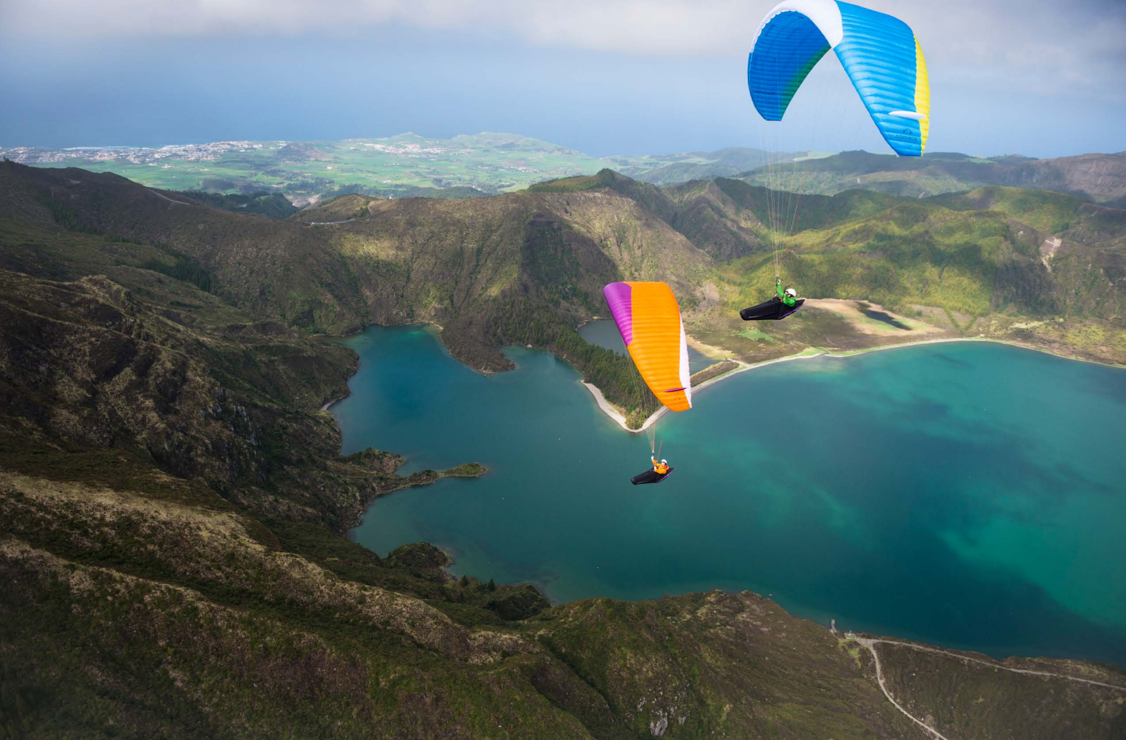
Aérogologie parfaite : belle hauteur de la base au-dessus du Lagoa do Fogo.