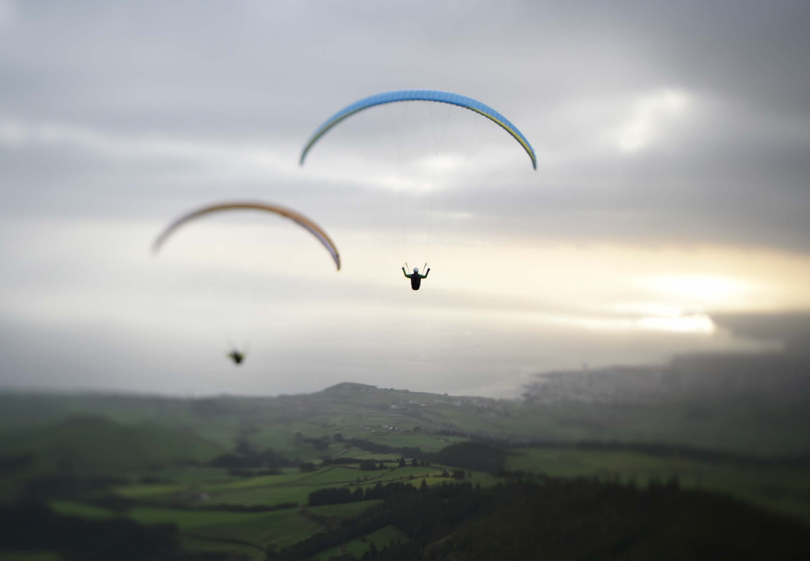
Plané final dans le coucher du soleil près de Lagoa.