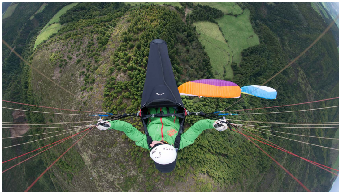
Aux Açores, la verdure côtoie un univers minéral.