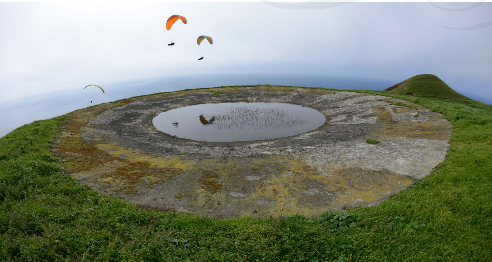
Conditions tranquilles du soir près de Ginetes.