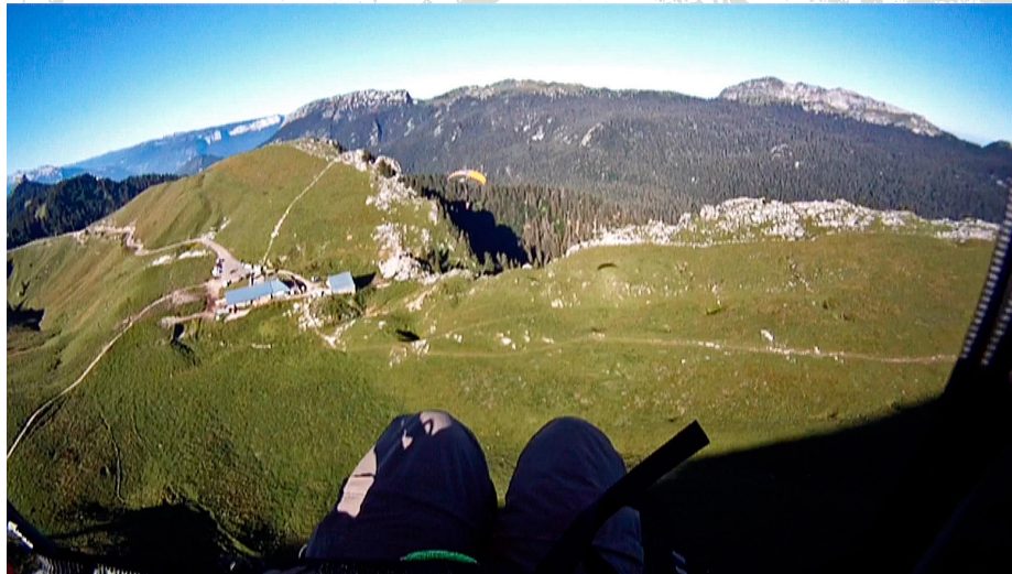
Décollage du Charmant Som en direction du col de la Charmette. Derrière la crête, seule une petite prairie pourra nous accueillir dans ce tapis d'arbre...

Là-haut on commence à recroiser des marcheurs. Ce satané vent d'Ouest nous fait perdre espoir de décoller de ce sommet peu pratiqué par les parapentistes. La brise ne prendra pas le dessus de sitôt. Prochain objectif bien connu, Chamechaude par le col de Porte. Allez, on y croit dur comme fer ! Malgré sa bonne orientation, ce sont les nuages accrochés à son sommet qui nous empêcheront de décoller. On rejoindra donc l'atterrissage des Eymeindras à pied. La marche commence à être longue. Déjà 2 sommets sans vols et des dizaines de kilomètres dans les pattes. Dernier espoir, décoller de Pravouta pour un glide final nous menant droit à St Hilaire. Nos espoirs tombent vite à l'eau lorsqu'au col du Coq nous entendons le vent ronfler. Les prévisions avaient tout faux... C'est très péniblement et en marchant que nous bouclons l'aventure après une dernière journée sans vol et pleine de faux espoirs. L'objectif a été pourtant atteint, un dépaysement total, des vues sur la Chartreuse uniques, des décollages et atterrissages jamais pratiqués, des rencontres atypiques, des sentiers presque tous désertés... Tout ça juste derrière chez nous ! ■