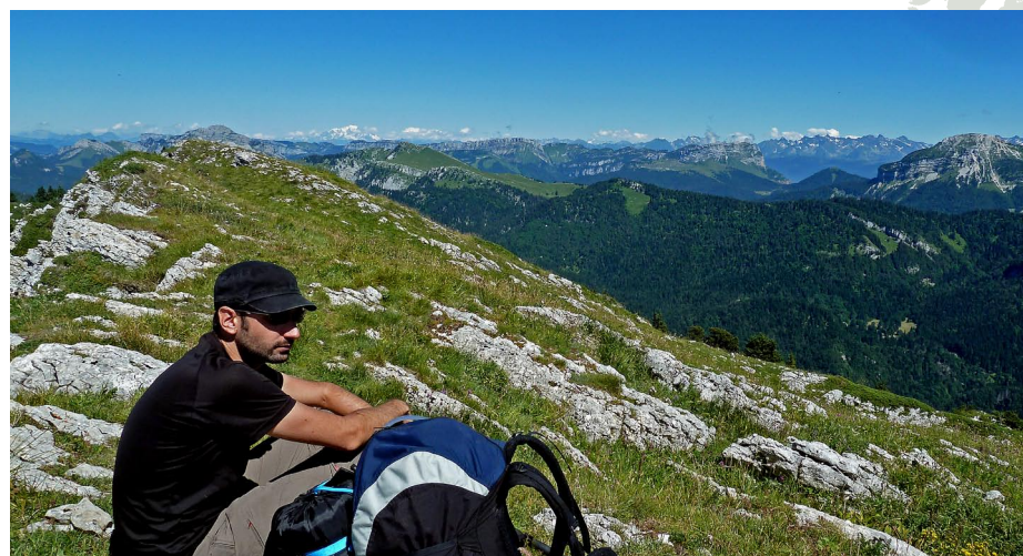
Vue de la Chartreuse depuis le sommet du Rocher de Chalves. Le panorama est splendide avec une visibilité optimum.