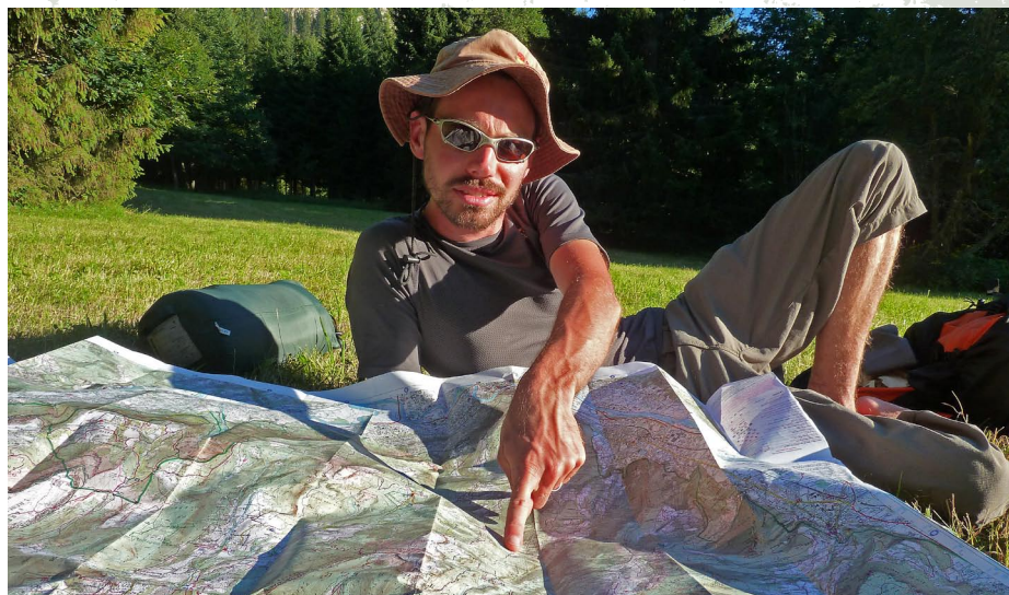
Si près et pourtant si dépaysant, nous découvrons des sentiers peu fréquentés.

Bon finalement on aura vu plus d'avions de ligne que d'étoiles filantes. La nuit sans nuage est plutôt fraîche, mais le plaisir de dormir en montagne à la belle étoile reste intact.