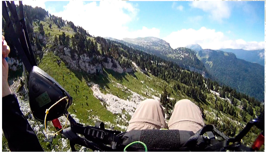
Une vue sur la Chartreuse peu courante avec la prairie de la Dent de Crolles au fond.

Dernier jour de vivres pour revenir à St Hilaire et il nous reste pas mal de kilomètres. Les conditions semblent bonnes pour voler. Montée par un sentier méconnu à la Pinéa.