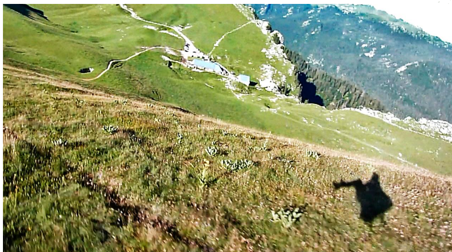
Décollage au lever du soleil juste à côté des chamois. Que du bonheur.