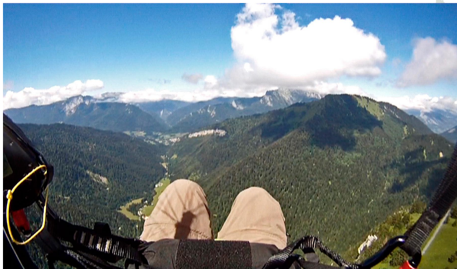
Elle est pas belle cette Chartreuse ?