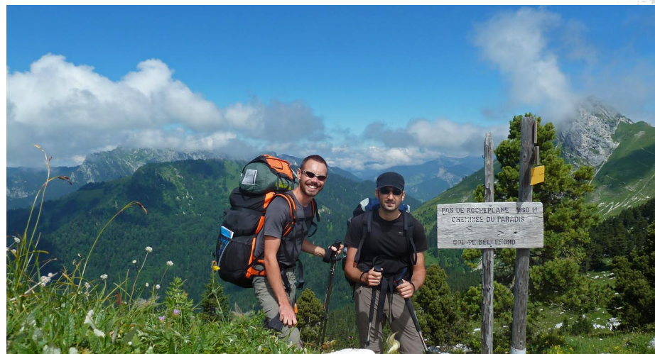
Juste avant notre premier vol au Pas de Rocheplane. Les sacs sont pleins à craquer pour nos 3 jours d'autonomie.