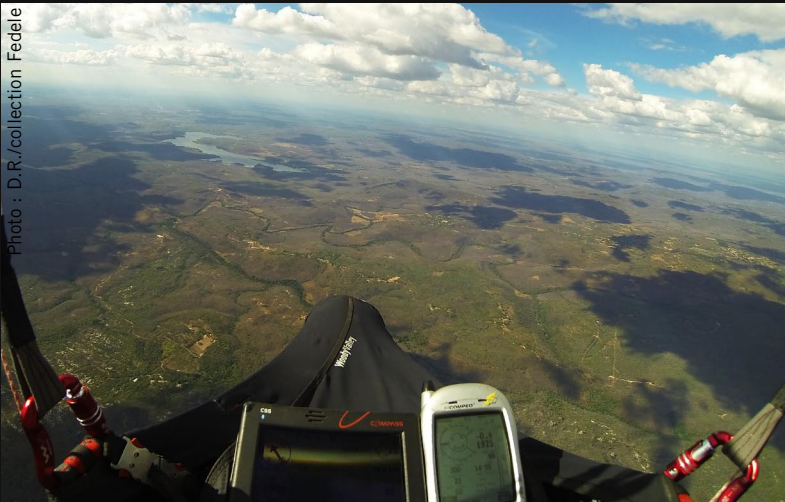
Nicole sur le chemin du succès. Sur le serveur de Coupe de Distance XC-Globe ( http://xcglobe.com/olc/index.php/catalog/#si&flights&1328309&map ), la distance calculée est de 381 kilomètres. Dans la déclaration du record à la FAI, la distance est de 376,5 km.